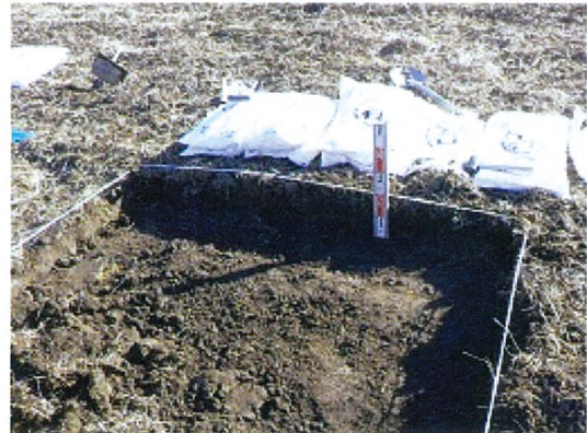
各実験区画は、深さ20cmまで掘って、 汚染土壌と低減剤を投入する