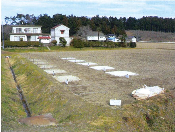
実験地2 実験区画 2m×2m 12区画で、 低減剤種と投入条件を変えて実験